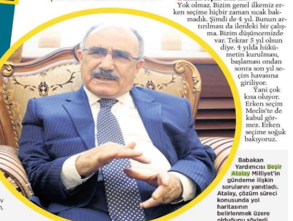
Başbakan Yardımcısı Beşir Atalay Milliyet'in gündeme ilişkin sorularını yanıtladı. Atalay, çözüm süreci konusunda yol haritasını belirlemek üzere olduğunu söyledi.

■ Özerklik tartışmaları yaşandı. Nasıl bakıyorsunuz buna? Çok söylemler olur. İnsanlar konuşuyor. Orada o tartışmalar yapıyor. Kimilerinde korkular ve endişeler var ama biz emniyetin hassasiyeti aynı. Özerklik söylemleri başkanlığı seçiminde sayın Demirtaş'ın konumu. O bir mesaj veriyor. Bütün Türkiye'de sübat Türkiye'ye ilgili yok diyorlar. Kendileri de sübat yapmaya doğru ilerliyor. Türkiye'den ayrılmam diye bir konu pilmamak lazım. Bizlerin de en önemli hassasiyetimiz birlik ve bütünlüktür.